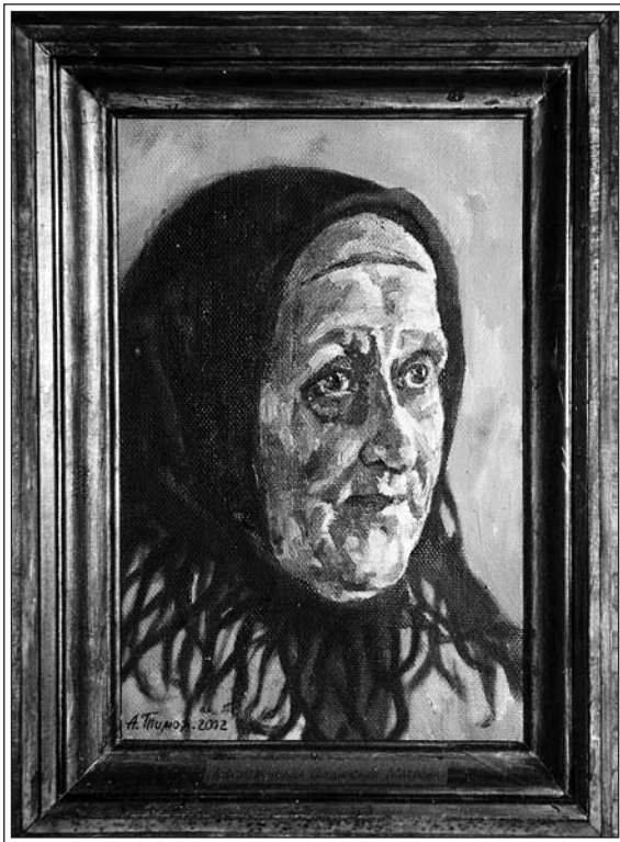
Матрена Викуловна. Портрет А. Тимофеева, 2002

сойдет, и до заморозков осенних. На выходные домой приезжали.