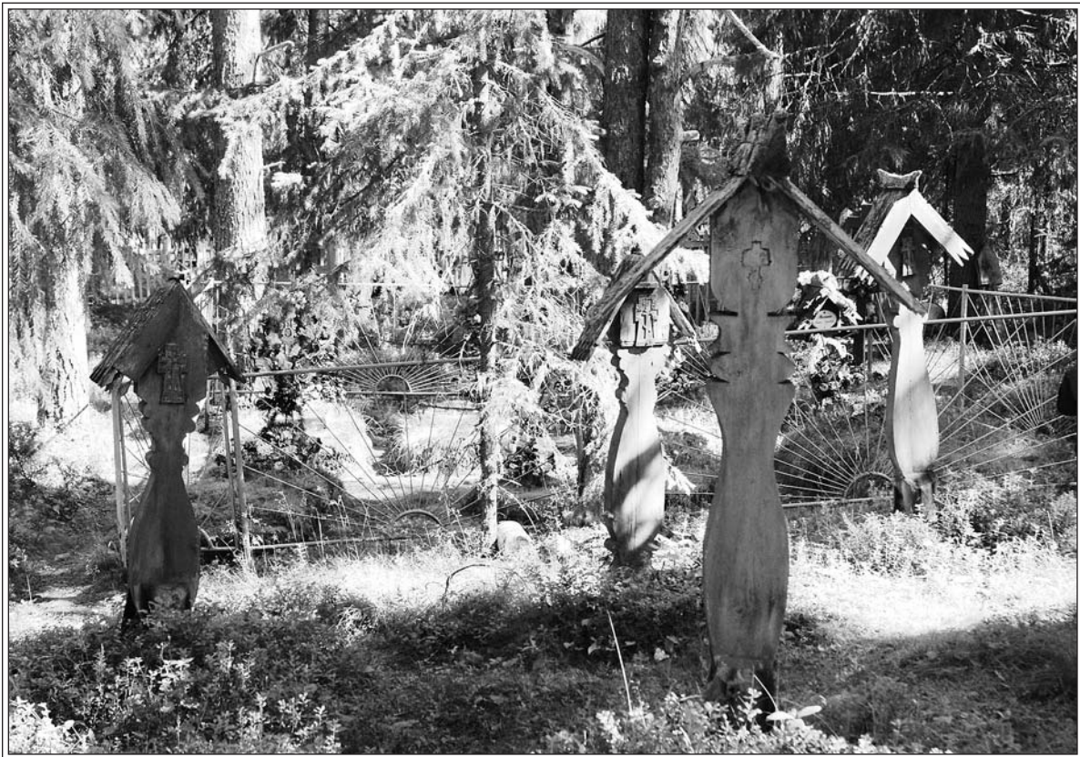
Кладбище в Гридино

А в 1958 г. я на тоне работать стала. На тоне мы впятером работали: четверо мужчин и я. В то время в колхозе уже МРБ (малые рыболовецкие боты) были, дорки, а раньше — всё на веслах. Рыбу всякую ловили, что попадало: треску, навагу. Ловили неводами, мерёжами. Морского зверя били на лудах (небольших островах): нерпу, белугу. Ловили и сдавали. Тоней было много: Кочка, Сухая Губа, Крестовая, Сон-ручей, Сосновцы. На тоню уезжали, как губа «распалится», как лёд