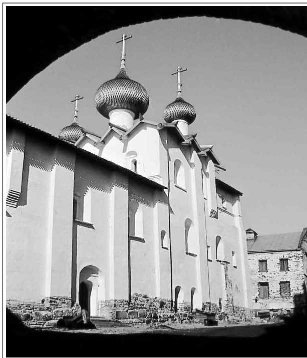
Успенская церковь

«ПАМЯТЬ» № 1. Самая ранняя «Память» относится к 1547/1548 гг. Начинается она так: «Лета 7050 шестаго. Паметь Филиппе игумену, хто што давали христороубцы на каменную церковь Успение Пречистые Богородицы и на трапезу. Филипп игумен дал пять рублей. Старец Дософей Рукин дал дватцать алтын. Старец Ларион Кубена дал полтину...» 4 . Далее на лл. 1–6 приводится длинный перечень из 129 имен жертвователей денег. Его замыкают имена двух соловецких старцев: «Старец Афонасей крылошанин дал два алтына. Старец Никон