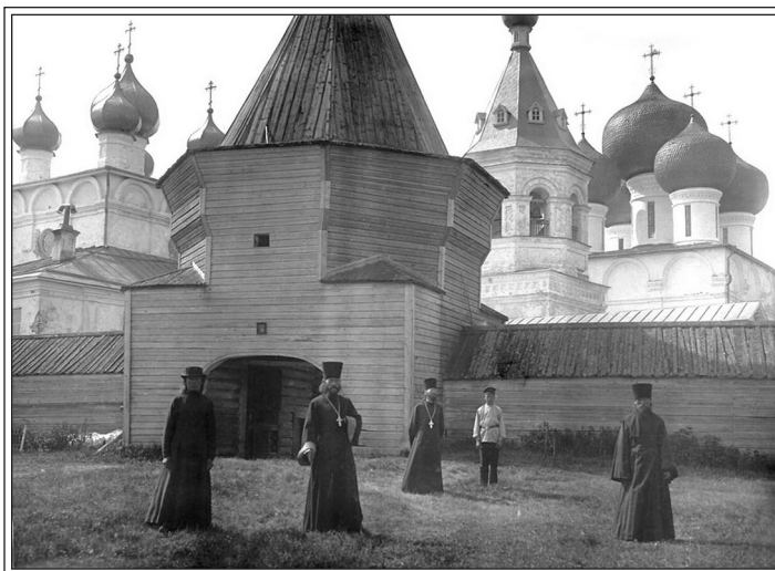
У стен Николо-Корельского монастыря. Фото не позднее 1906 г.

Наличие упомянутых канонника и Минеи в Корельской обители свидетельствует, что в ней были осведомлены о большинстве признанных церковью русских подвижников благочестия. Возможно, в какой-то степени они почитались ее насельниками. По крайней мере, в соответствующие дни в монастыре могли отмечать их праздники. Но лишь немногие русские святые, как мы убедились выше, обрели для корельских монахов