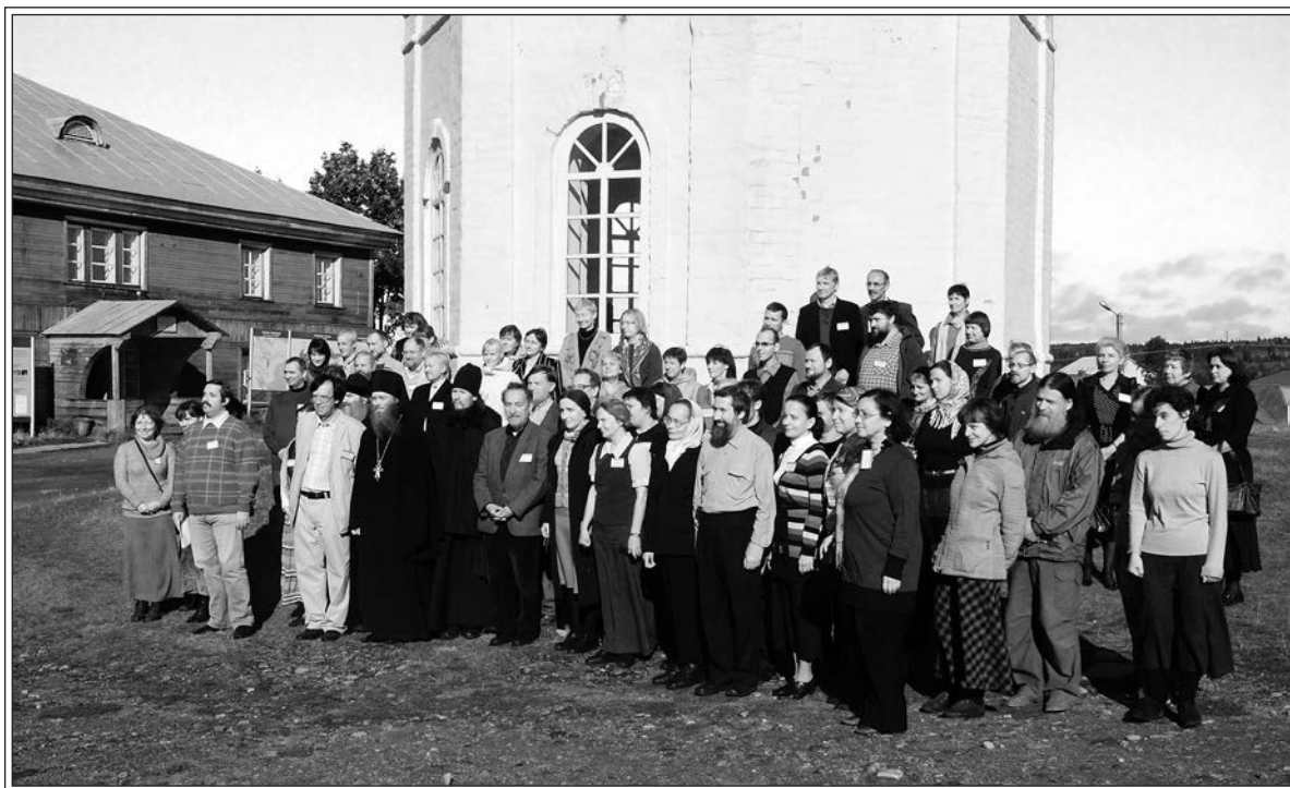
Участники Международной научной конференции по монастырскому наследию на Соловках. Сентябрь 2010 г.

наблюдали передачу РПЦ МП (Русская православная церковь Московского Патриархата. — А. С.) острова Анзер со всей его инфраструктурой, куда церковь сразу же перекрыла доступ местным жителям и туристам, как стерпели самозахват монастырем федерального памятника — скита на горе Секирной.