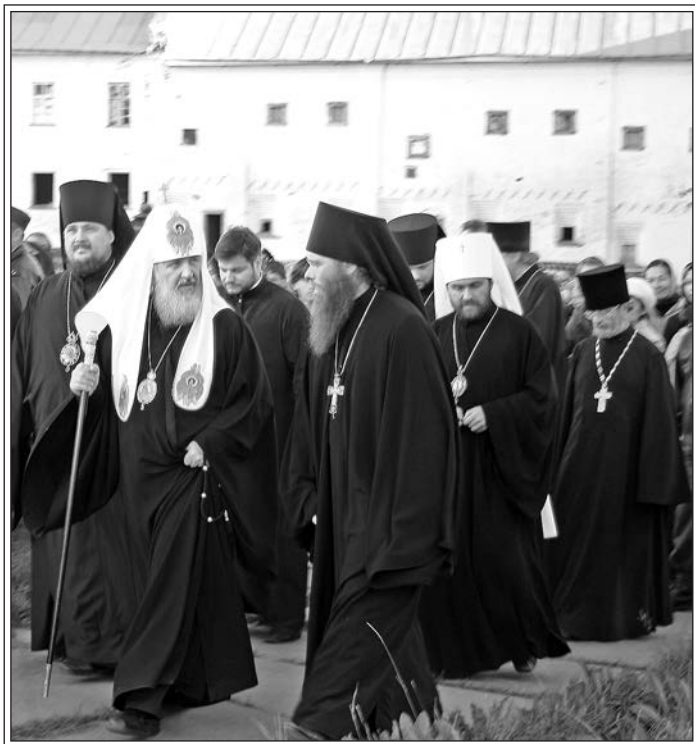
Визит Патриарха в Соловецкую обитель. Август 2010 г.

Изложенное выше — всего лишь тезисы. Одна из возможных точек зрения без претензии на окончательную и единственную истину. Возможно — повод задуматься. Но если круглые столы не будут предполагать формата постановки вопросов и попыток поиска ответов, если