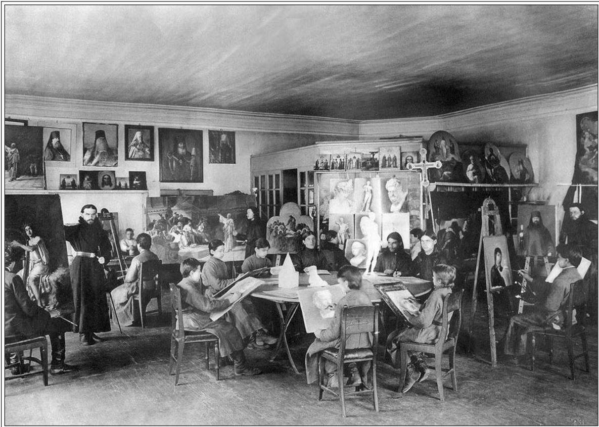
Иконописная мастерская Соловецкого монастыря. нач. XX в.

юродного брата и два пейзажа (прибой и березки). Все работы были сфотографированы 35 .