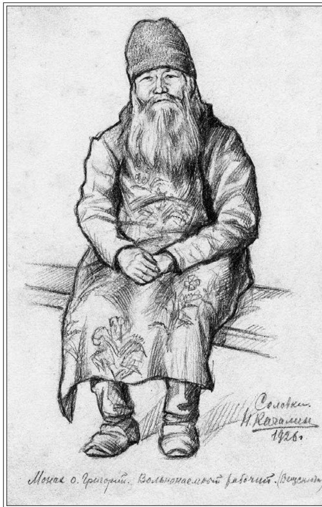
Монах о. Григорий, вольнонаемный рабочий

К Соловецкому монастырю поморы относились с почитанием и благоговением. Соловки для паломника — это место встречи с Божьим