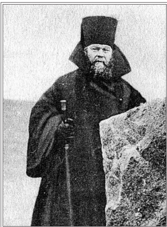
Архимандрит Иоанникий (Юсов) Фотография нач. XX в.

монастыря) задумал подготовить их к службе в монастыре в качестве священников и дьяконов, для чего открыл богословское училище с семинарской программой и специально пригласил из Петрограда преподавателей. Учились новые монахи два года, после чего Иоанникий сделал кого попами, кого дьяконами. Попы и дьяконы освобождались от тяжелых физических работ, но в это время для обеспечения электростанции водой строились каналы, и на эту работу привлекали всех, в том числе молодых попов и дьяконов. Новым попам и дьяконам это не понравилось, и они написали жалобу на Иоанникия: настоятель самоуправничает, вместо того, чтобы молиться, роет каналы, растрчивает монастырские деньги на это дело. Получив жалобу, Синодальная контора направила в Соловки ревизора — вологодского vicарного епископа Антония. Он прожил в монастыре месяц, составил акт — в нем не было ни одного слова в пользу Иоанникия — и уехал. Получив Акт ревизии, Контора срочно потребовала от Иоанникия объяснения по нему. Объяснение писали коллективно, всем собором. В него входили настоятель Иоанникий, наместник, казначей, ризничий, духовник, делопроизводитель (иеромонах). Когда я приехал, писался черновик.