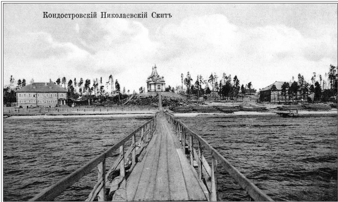
Кондостровский Николаевский Скитъ

Кондостровский Николаевский скит. Открытка нач. XX в.