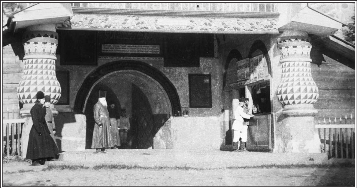
У Святых ворот. Фотография Я.И. Лейцингера нач. XX в.