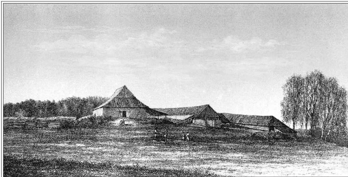
Кирпичный завод с обжигальной печью. Литография В.А. Черепанова. 1884 г.

кирпича 4 . Как правило, на производстве работали люди, прибывшие в монастырь из различных поморских сел. Они носили и возили в ларь глину, резали и правили кирпич, укладывали его в яму, разжигали ее дровами, и после охлаждения складывали кирпич в стопы. В целом технология производства кирпича не отличалась сложностью. В России в XVII–XIX вв. не редко устраивали собственные кирпичные заводы даже при строительстве отдельных храмов или усадеб. Прихожане, крестьяне и помещики, считали устройство небольших кирпичных заводов при возведении строений более выгодным, чем покупку его в специализированных пригородных слободах и доставку на место строительства. На таких заводах обычно работали сами прихожане (включая местных крепостных крестьян) под руководством знающих производство людей. Однако размах изготовления кирпича на Соловках не сопоставим с такими частными начинаниями.