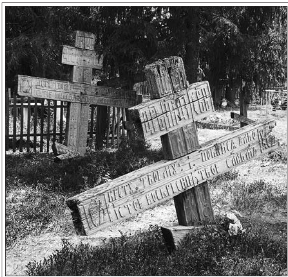
Кладбище в Азаполье. Фотография 2011 г.