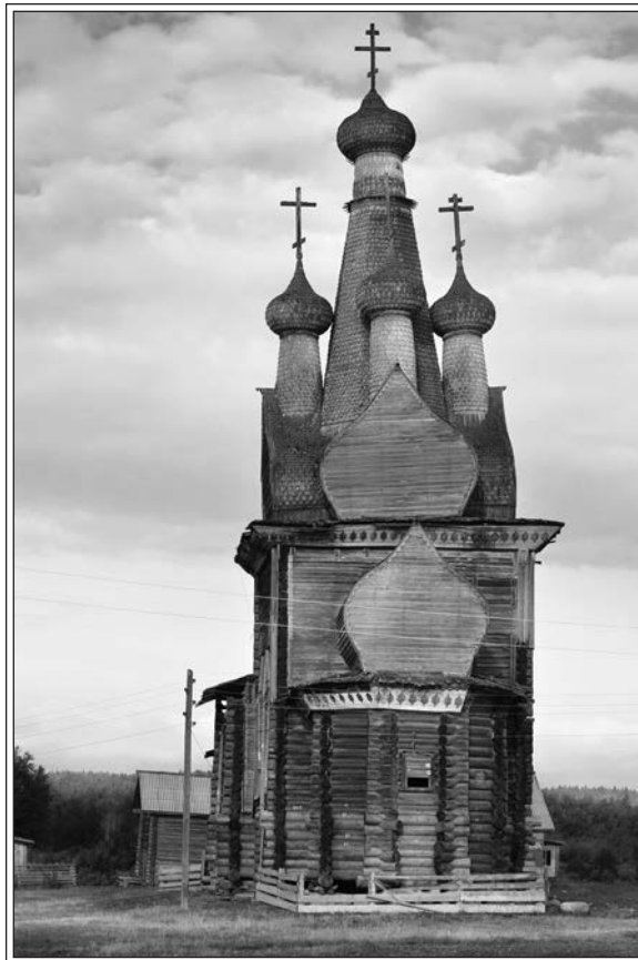
Одигитриевская церковь в с. Кимжа 1709 г. (в настоящее время разобрана)

Всяки года были. Было холодно и было голодно. Не хватало ни картошки, ни ячменя. А во время войны нажились, конечно, всяко. Мы с матерью сушили дерн с полей. Этот дерн был лучше моху, ели его. Сначала промоют, высушат на улице, потом сушат в печках на листах железных.