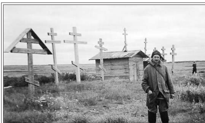
На Большой Боровой тоне. Фотография О.А. Коткина

можно, но винт никак не поменяешь. И все-таки я обвязал себя веревками и залез с кормы в воду, чтобы вытащить вал. Но уже в воде я понял, что вытащить вал в таких условиях нельзя.