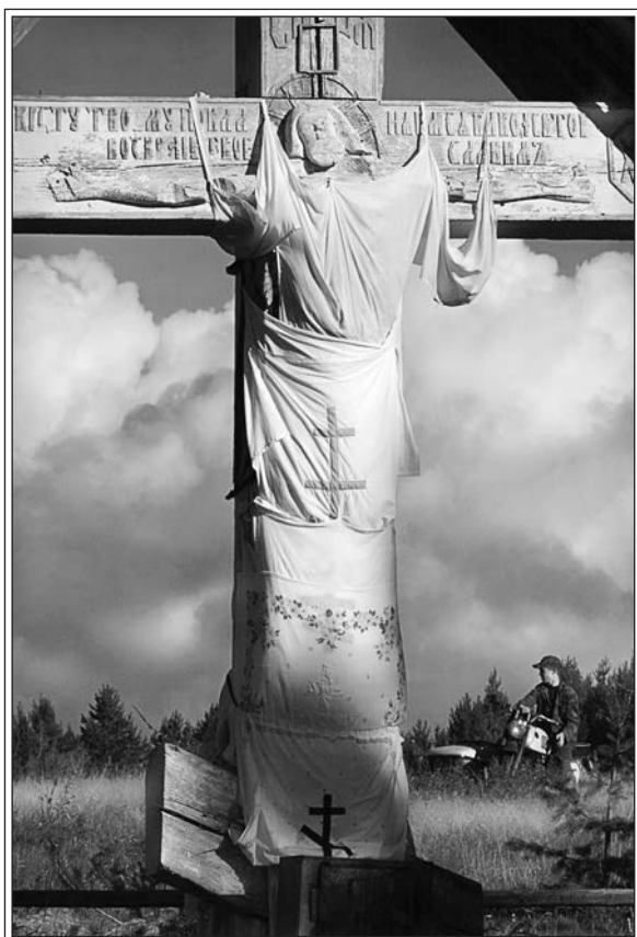
Крест в Кимже, пострадавший от рук вандалов

Селивановой. Не деревня, но дом оказался музеем. У бывшего хозяина были золотые руки, и все вещи в доме об этом не просто говорили — пели.