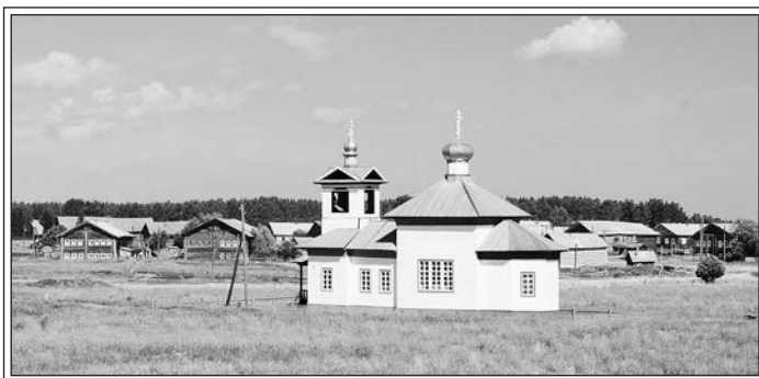
Погорелец. Фотография 2011г.

Жито надо вспахать, посеять, сожать, смолотить. Потом вывезать, потом высушить и на жерновах смолоть, просеять — вот когда мука получится! Колобы натяпают, да житники, да сковородники. Житники, крупники в печи на поду выпекали. Под выпашут помелом — раз — житники готовы быстро. Если сдобно тесто, то молоко клали. А житники пекли на воды. Соль, вода. Дрожжей раньше не было. Закваска была в чулане на полке. Это тесто жило. А пресно́ — корки скали, и крупу на молоки на эти корки, сметанкой польют, на лопату и в печку на под. На дожин, бывало, горы шанёг напекут. Ягод привезут, молока флягу сквасят, всю посуду займут на простоквашу, а потом напекут на дожин. Дожин — жито выжали и праздник устроили. На нашем конце собирались, и на Бору. А где клуб, там уже соберемся все вместе поплясать. Под гармонь русского, да кадрили, да «болван», да песен попоём. Болван — это вроде игры. Когда гармони не было, под балалайку плясали.