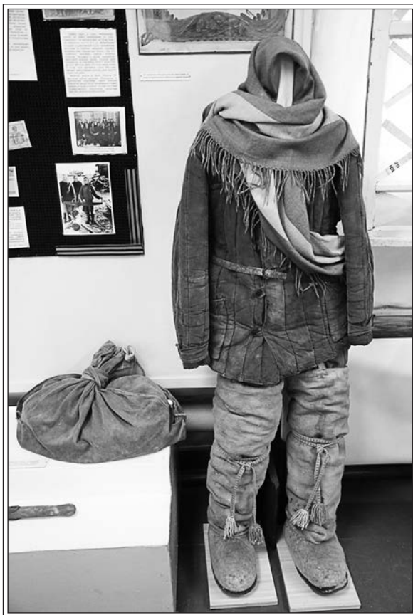
Одежда женщин на лесозаготовках Мезенский историко-краеведческий музей