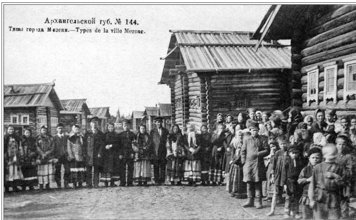
Жители Мезени. Открытка нач. XX в.

красную лисицу в серебряном поле. Стоит теперь уездный город Мезень, обложившись множеством больших и малых деревень и неудобною к обитанию тундрой, со своим уездом, больше которого по пространству и меньше по населенности нет уже другого на всем громадном протяжении Великой России» 4 .