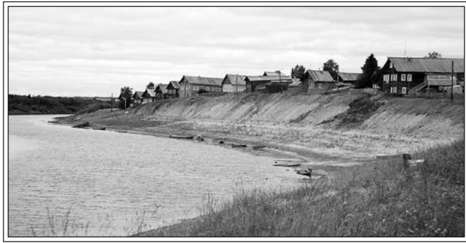
Кимжа. Фотография 2011 г.

Сегодня решили отдохнуть и переварить впечатления. Можно поспать, можно сделать зарядку с видом на реку. Просторы необозримы. Перед глазами слоеный мезенский пирог. Если