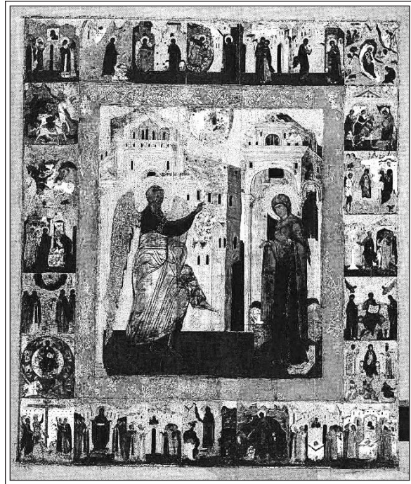
Благовещение с изображением Акафиста Богородице. 1628 г. Мастер Третьяк Гаврилов Кушников. Икона из Чудова монастыря Московского Кремля. Москва, музей Московского Кремля