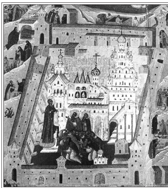
Пречестная и великая обитель преподобных Зосимы и Саватия, рекомая Соловки. Около 1630 г. Икона из Калужского Казанского женского монастыря.

Место хранящейся в Калуге иконы в иконографии Соловецкого монастыря определено М.И. Мильчиком следующим образом: «Вполне вероятно, что еще неизученная икона Успенского собора вместе с заглавными миниатюрами стали образцом для калужской иконы Зосимы и Саватия с 28 клеймами жития. Архитектура на последней передана с разной степенью точности: постройки за пределами монастыря чисто условны, а храмы же значуют собой переход от их обозначения к изображению. В их облике мы находим некоторые новые детали: Успенская церковь получила третью главу, появилась трехшатровая звонница и каменные переходы. Преображенский собор выглядит скорее столпообразным, нежели шатровым. Все эти «поправки», кроме последней, соответствуют новым постройкам начала XVII в. Сопоставленные со сведениями по истории Казанского Богородицкого монастыря г. Калуги, откуда происходит данный памятник, они позволяют датировать его первой четвертью XVII в.» 8 . Таким образом, уже на первом этапе изучения описываемого произведения была признана его историческая ценность как источника по соловецкому церковному строительству. Что касается упомянутой в приведенной цитате иконы Успенского собора, то речь идет о произ-