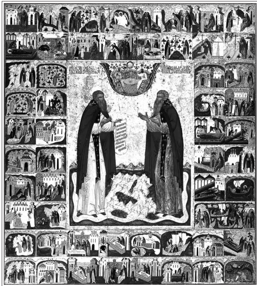
Зосима и Савватий Соловецкие с 56 клеймами жития. 1550–1560-е гг. Икона из Преображенского собора Соловецкого монастыря. Москва, Государственный исторический музей

Из приведенных примеров можно сделать вывод о нестабильности сюжетного репертуара житийного цикла, представленного в иконописных изображениях Соловецкого монастыря XVI в. Можно еще указать на то, что существует икона прп. Зосимы и Савватия Соловецких, датируемая 1550–1560 гг., с 56 клеймами жития, прежде находившаяся в местном ряду иконостаса Преображенского собора Соловецкого