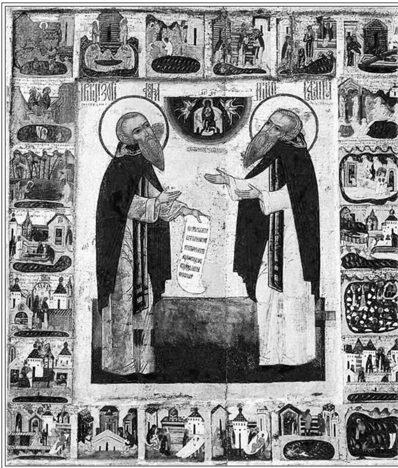
Зосима и Савватий Соловецкие с 22 клеймами жития. Конец XVI в. Икона из Белозерска. Санкт-Петербург, Государственный Русский музей

вдоль лужи 28 сцен представляют лишь его часть, тогда как остальные сцены рассеяны по острову и по окружающему его морю. Эти сюжеты, пронумерованные и снабженные даже более или менее пространственными сопроводительными надписями, намного увеличивают тематический репертуар. Данная тенденция, как можно убедиться, восходит к образцам середины XVI в.