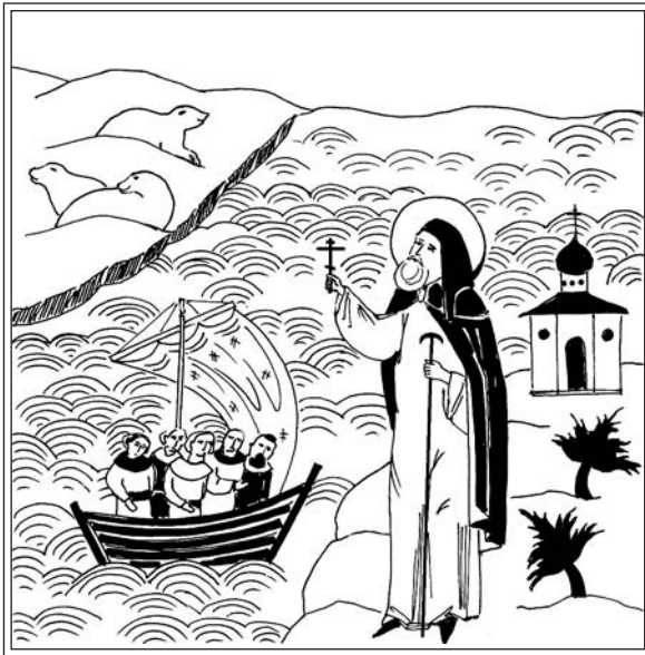
Чудо прп. Иринарха — явление на весновании погибающим людям. Современная миниатюра

путь к берегу. При этом он назвал свое имя: «Аз есмь Соловецкого монастыря игумен Иринарх». Весной 1629 г. спасенные охотники, жители Северной Двины, приплыли в монастырь и рассказали об этом чуде.