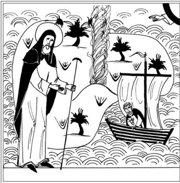
Прп. Иринарх благословляет построить храм в анзерском Троицком скиту на том месте, где его духовный сын видел «столпъ огнен, до небес восходящъ».