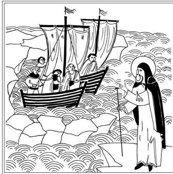
Чудо прп. Иринарха — явление на весновании погибающим людям. Современная миниатюра

После того, как текст «Сказания о чудесах Иринарха» был закончен и удостоверен подписью «прежебывшего игумена Колязина монастыря», вероятнее всего, он был представлен Новгородскому митрополиту, от благословения которого зависело прославление нового чудотворца. Но неизвестно, когда и как это произошло; никаких документов, касающихся прославления игумена Иринарха, не сохранилось. Неизвестно и то, когда были сложены тропарь и кондак прп. Иринарху. Единственным свидетельством почитания прп. Иринарха в Соловецком монастыре в 60-е гг. XVII в. служит «Повесть о чудесном исцелении инока Исаяи в Анзерской пустыни» (1667 г.); в ней Иринарх упоминается как