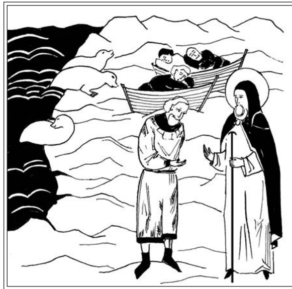
Чудо прп. Иринарха — явление на море весновальщикам и предсказание им добычи. Современная миниатюра

19 января 1940 г. после закрытия Соловецкой тюрьмы мощи соловецких святых были увезены в Центральный антирелигиозный музей (ЦАМ) в Москву, а в 1946 г. после закрытия ЦАМ пере-