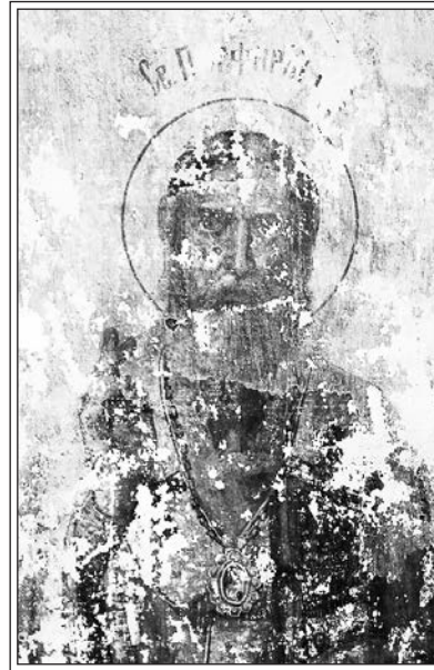
Св. Порфирий Газский

В 1916 г. в связи с началом войны и призывом на военную службу не оказалось работников, согласных за 25 рублей в месяц зимой нести вахту по 8 часов в сутки в холодном маячном фанаре на