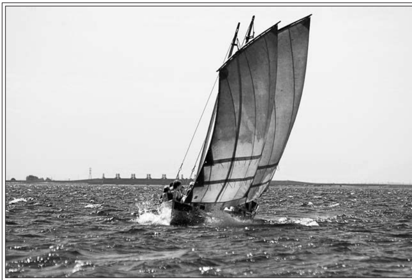
Гичка под парусами.

...Мы качались в открытом заливе, пытаясь различить форт Чумной. Невдалеке от нас шел залитый огнями многоэтажный лайнер «Берлин». Его рассеянный свет, озарявший пространство вокруг, позволил нам увидеть контуры Чумного. В километре от нас поднималась из воды мощная крепость округлой формы. В свое время такой форт мог быть непреодолимой преградой для неприятельского флота. Его настоящее название — форт «Император Александр I». Что касается Чумного, то рассказывают, что в начале века сюда свозили больных чумой, где они, отрезанные от всего мира, могли спокойно умереть. Когда все было кончено, для уничтожения следов эпидемии форт обложили горючими материалами и подожгли. Трое суток был охвачен пламенем форт «Александр I», а шлейф дыма еще долго застилал небо над заливом. С тех пор его стены покрывают