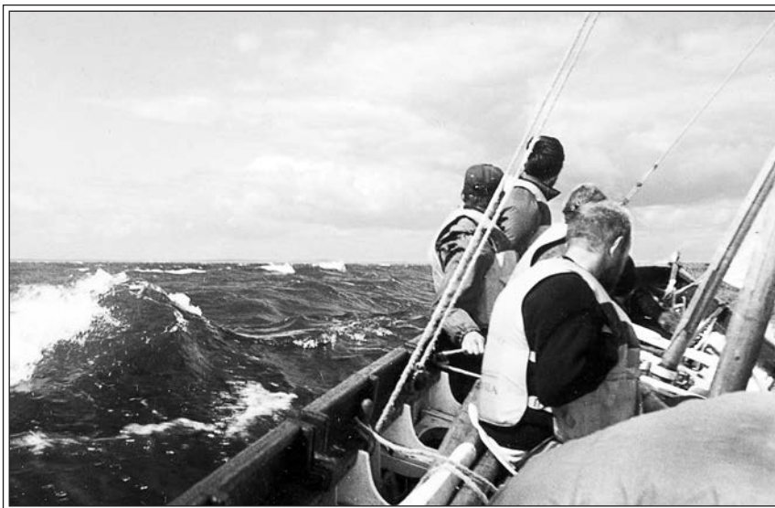
На борту гички.

открытая парусная лодка с двенадцатью людьми на борту.