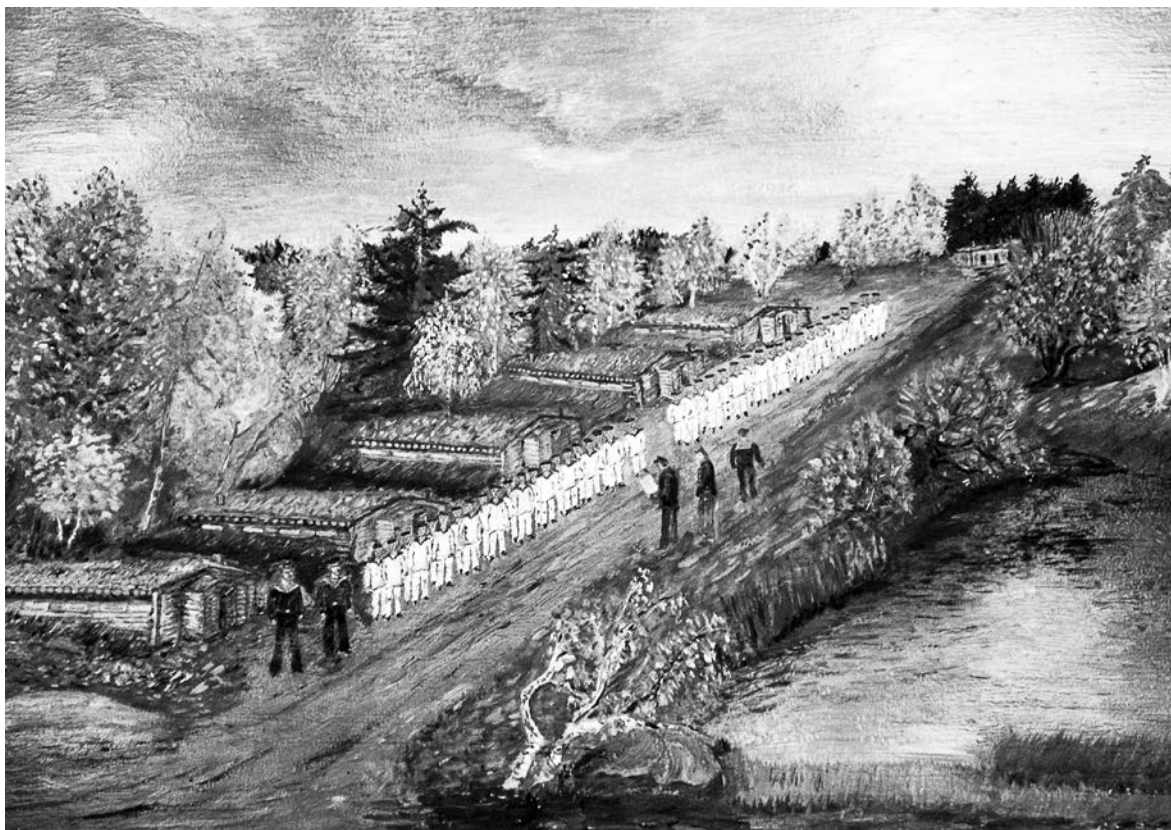
Школа юнг в Савватьево. Рисунок автора

Стволы берёз изогнуты и скручены холодными ветрами. Дальше от моря в глубь леса — берёзы стройные и высокие. Растут ель и сосна. Стволы не толстые, но высокие — настоящий мачтовый лес. Встречаются небольшие полянки с полевыми цветами. Направо, налево и вдалеке — озёра и озёра. Озёра везде. Большие и маленькие, продолговатые и круглые. Каждое озеро по-своему красиво, отражает полную гамму цветов заходящего и восходящего солнца. Тихо. И даже эти непутёвые ребята идут молча, созерцая красоту земли русской в 150 км от Полярного круга. Здесь работал известный художник Михаил Васильевич Нестеров. Очарованный красотой этих мест, он написал полотна «Молчание» и «Мечтатели».