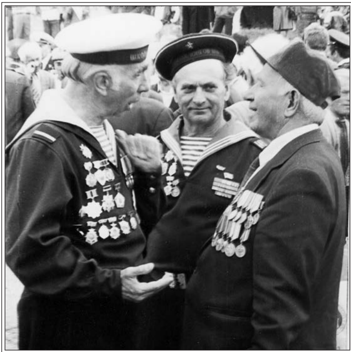
Юнги-ветераны на Соловках. Фото 1980-х гг.

бросил настоящую гранату РГ. Она наносит смертельное поражение на расстоянии до 5 м и применяется в наступательных боях. В оборонительных боях используется граната «лимонка». Её осколки наносят смертельное поражение на расстоянии до 200 м. Это всё было в программе юнг первого набора.