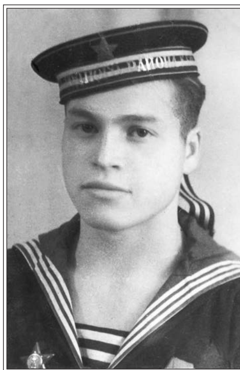
Иван Дудоров. 1940-е гг.