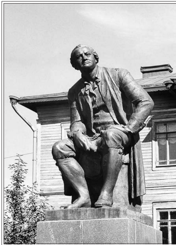
Памятник М.В. Ломоносову в с. Ломоносово.

На Соловках многое удивительным образом напоминает о Ломоносове. Нет, не в прямом,